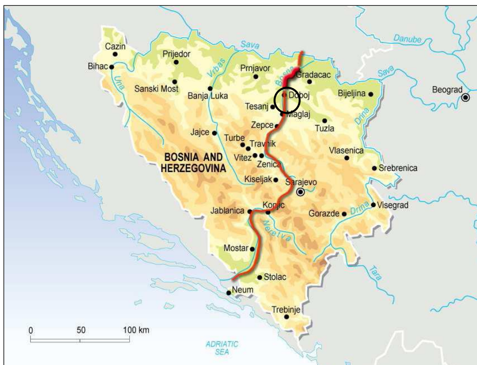
Slika 1 Lokacija Projekta

Područje projekta se nalazi na sjeveroistoku BiH, oko 120 km sjeverno od Sarajeva i neposredno južno od Doboja (Slika 1). Područje je pretežno ruralnog karaktera sa seoskim naseljima razbijenog tipa, kao i skladištima, komercijalnim objektima i manjim industrijski objekti za preradu drveta i plastike duž regionalne ceste.