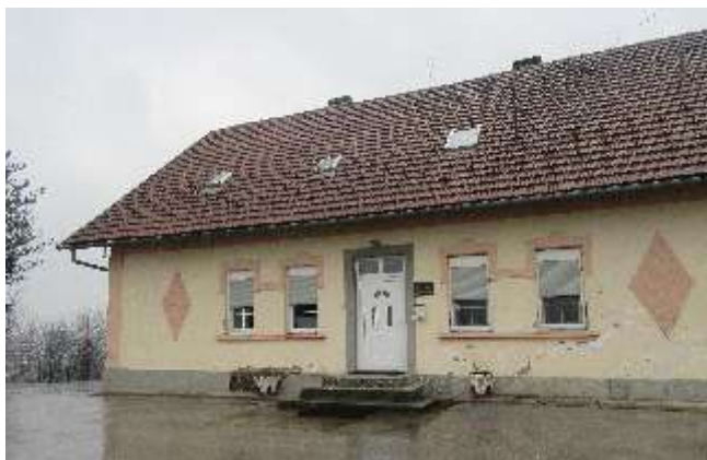
ŽUPNA KUĆA VAPI ZA OBNOVOM

Na prostoru općine Usora smještena je župa sv. Ane – Žabljak koju želim malo približiti žiteljima ovog kraja. Po crkvenom ustrojstvu župa spada u usorski dekanat koji broji ukupno 8 župa, počevši od Doboja pa sve do Komušine.