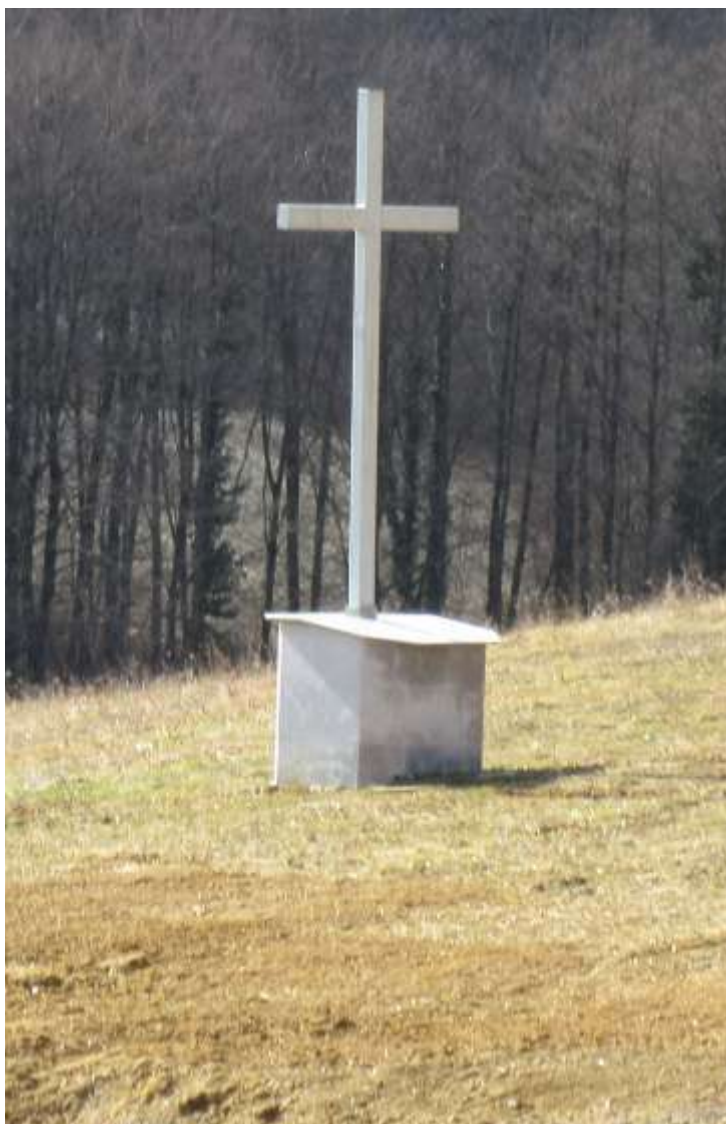
Novo groblje u Bejićima

djeteta, a umrlo je jedanaest osoba. Vjenčana su samo dva para. Sakrament svete krizme primit će devet krizmanika. U odnosu na prošlu godinu župa broji 49 osoba manje. Od vlč. Miškića dalje doznajemo da oko 20 % vjernika redovito sudjeluje u misnim slavljinama. "Posebno je svečano svakoga 8. u mjesecu kada vjernici iz cijele Usore hodočaste pobožnosti Gospe od brze pomoći", kaže župnik. U tijeku je aktivnost na izgradnji