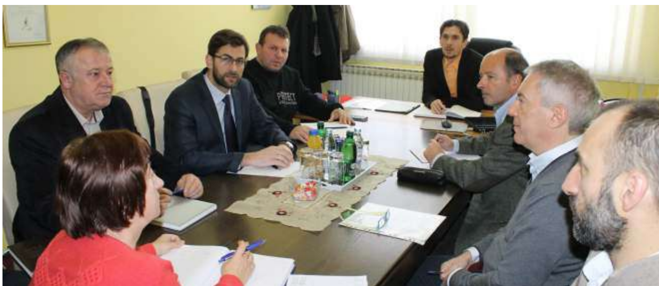
Predstavnici Ferretto Group Central Europe

U Povodu najvećeg kršćanskog blagdana, sa željom da se u svima nama probudi uskrсна nada, te da u tom duhu, skupa pridonesemo boljitku naše općine, sretan i blagoslovljen Uskrs svim Katolicima.