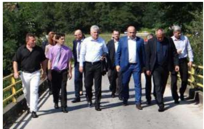
Most je prioritet!

Na temelju ovih programskih ciljeva, kao načelnik ću donositi godišnji plan rada i kroz nekoliko osnovnih točaka ga prezentirati Općinskom vijeću i javnosti, kako bi po isteku svake godine mogli pratiti rad i mjeriti izvršenje. Za ovu godinu već je išla informacija vijećnicima i krenulo se u samu provedbu. Istina je da Općina Usora ima mali proračun koji se proteklih godina kretao oko dva miliona KM, osobito kada se gleda stvarno izvršenje. Općina nažalost nema prirodnih resursa da bi koncesijama, odnosno naknadama koje iz toga proističu punili proračun. Odgovorna rješenja će se naći u našem apliciranju projekata iz različitih oblasti. Naime, plan je aplicirati na sve moguće izvore, kod viših razina vlasti, fondova i slično. Ove godine smo usvojili proračun u iznosu od 3.055 000,00 KM iz razloga što imamo dio prenesenih namjenskih sredstava, a uglavnom se odnose na započete projekte. Primjerice, imamo 233.000,00 KM za izgradnju mosta preko rjeke Usore. Zatim su tu odluke i ugovori za više manjih