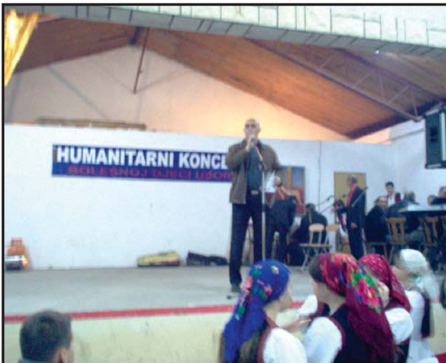
Detalj s koncerta

MZ Sivša u svadbenom salonu "Tokić" organizirala je "Usorsko veče". U bogatom kulturno-zabavnom programu sudjelovale su izvorne skupine: Derventski Biseri, Izvornjačka duša, Vesele Usoranke, Braća Jelić, Bracini bečari, Momačke noći i Baščovani, te dva