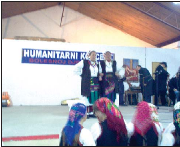
Detalj s koncerta

Božićno vrijeme, vrijeme darivanja iskorišteno je za organiziranje 2 humanitarna koncerta na kojima je prikupljeno nešto više od deset tisuća KM.