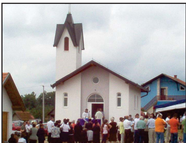
Svečano je bilo prigodom blagoslova kapele

Kao buduće ciljeve Filipović je izdvojio putno spajanje Jeleča i Filipovića, završetak asfaltiranja započetih dionica, te upošljavanje radno sposobnih, jer u ovoj MZ samo tri stanovnika imaju stalno zapošljenje.