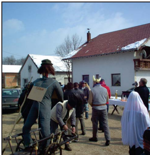
"Firaun" je na kraju platio