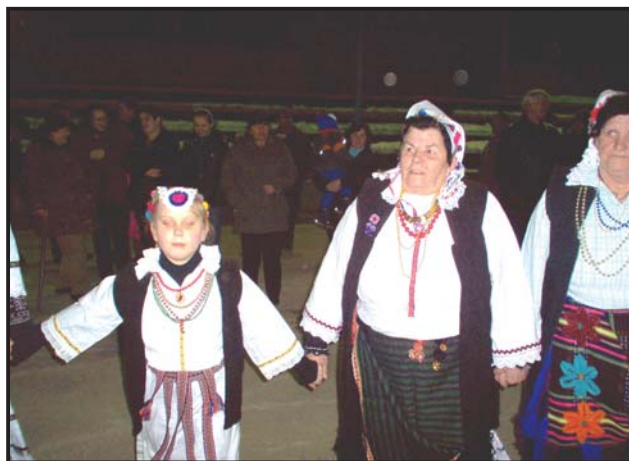
Članice folklorne skupine

Svoju pomoć obećali su i dva privatna poduzetnika koji su nazočili skupštini, Pejo Martinović i Bećir Bekrić. Gospodin Martinović osigurati će građevinski materijal za podne obloge, dok je vlasnik restorana "Bečo" na račun društva obećao uplatiti 1000 KM. Dio potrebnih sredstava ovdje planiraju osigurati sudjelovanjem u emisiji TV Bingo show FTV BiH.