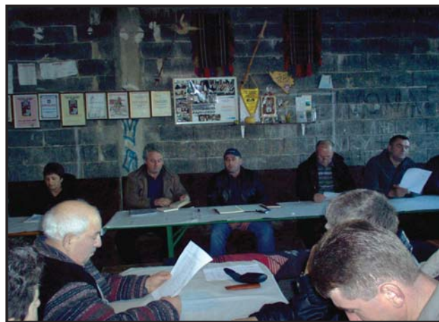
Detalj sa skupštine